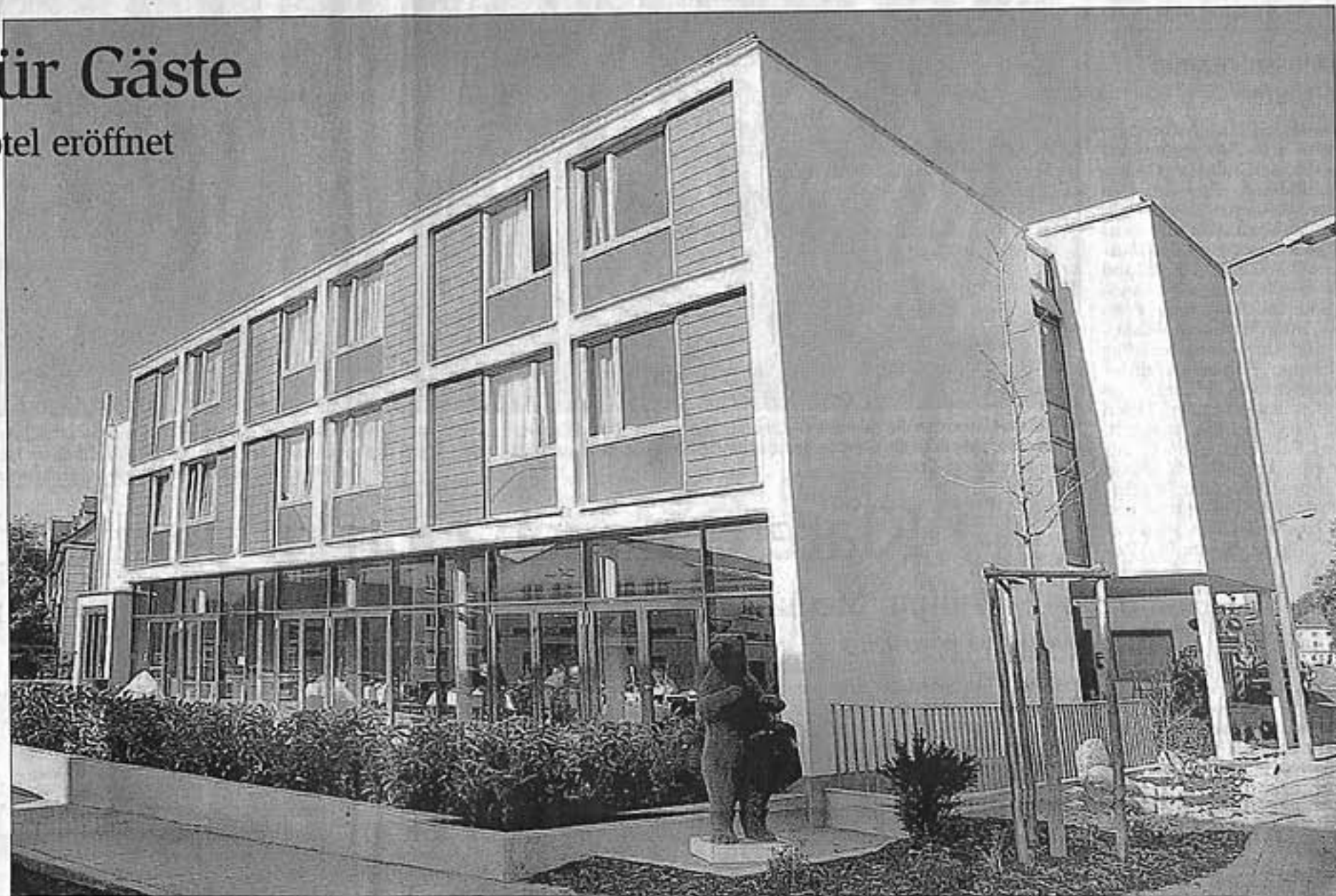
Hotel Corbin, weltweit erstes Feng-Shui-Hotel.

Bei der Errichtung des zweistöckigen Gebäudes wurden strengste Anforderungen an Baubiologie und Geomantie gestellt. Sichtbares Zeichen ist ein 1,3 Tonnen schwerer Bergkristall auf der Sonnenterrasse als positiver Energiepunkt. Weitere Hinweise und Ausdruck für Leben und Vitalität sind der Brunnen neben dem Eingang und eine Wassersäule im Foyer. Eine Wohlfühlatmosphäre wird auch durch modernste optische Mittel geschaffen: Auf eine Glasscheibe zwischen Lounge und Frühstücks-