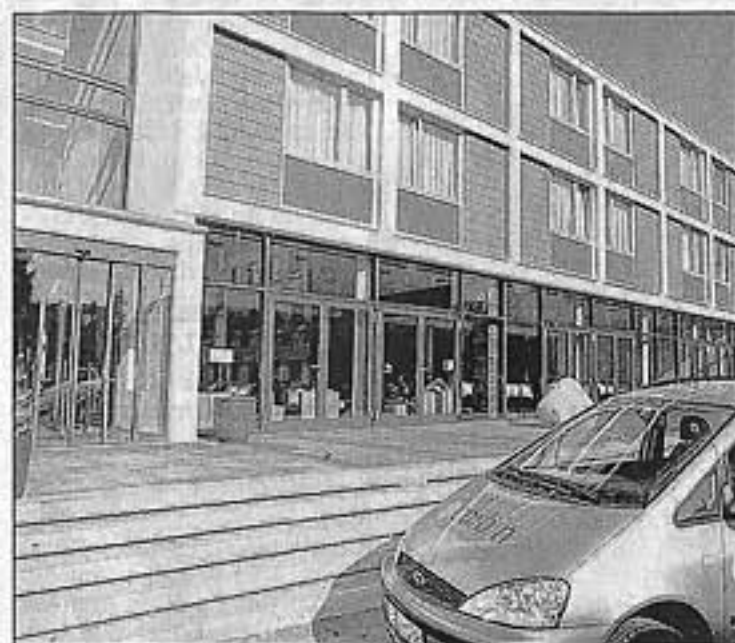
Der Eingangsbereich lädt schon zum Wohlfühlen ein.